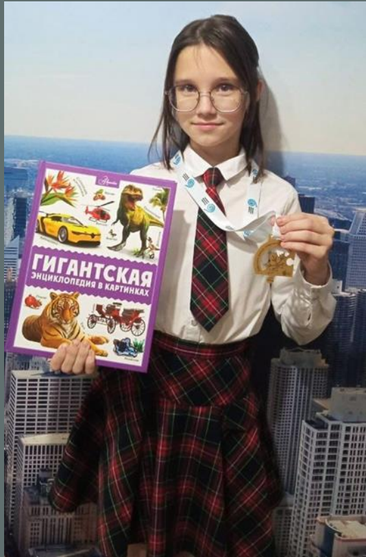
Акция «Отличный дневник»