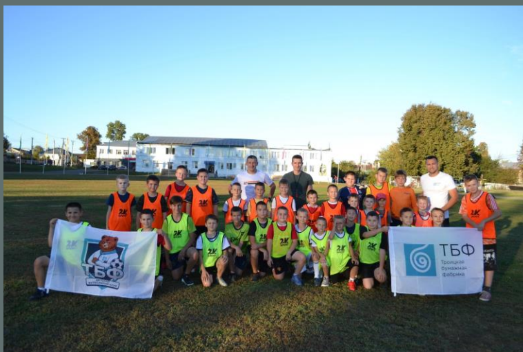
Детский футбольный клуб ТБФ