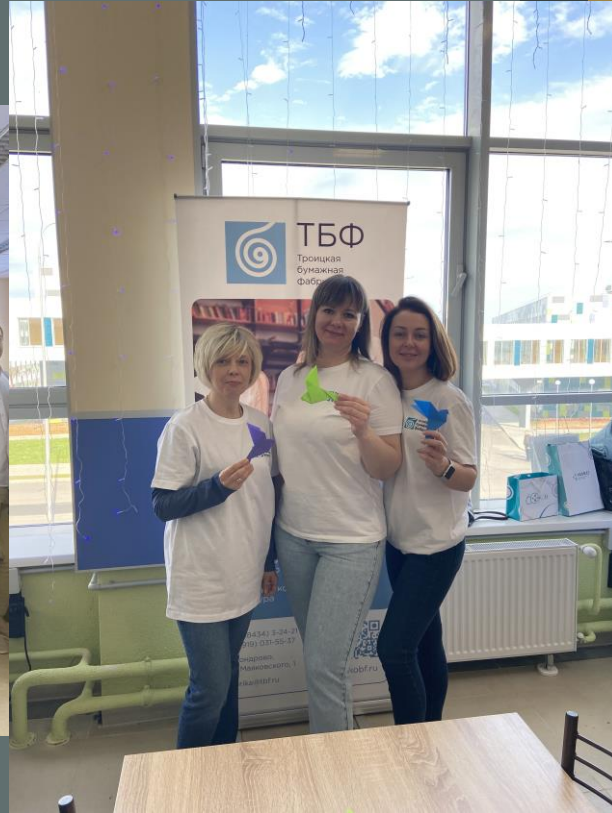
Проориентационная работа со студентами