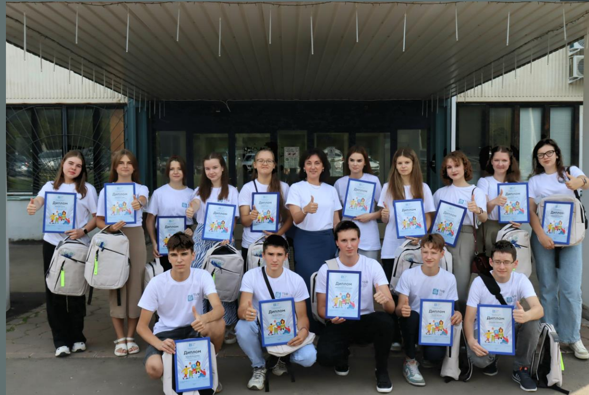
Летние трудовые отряды