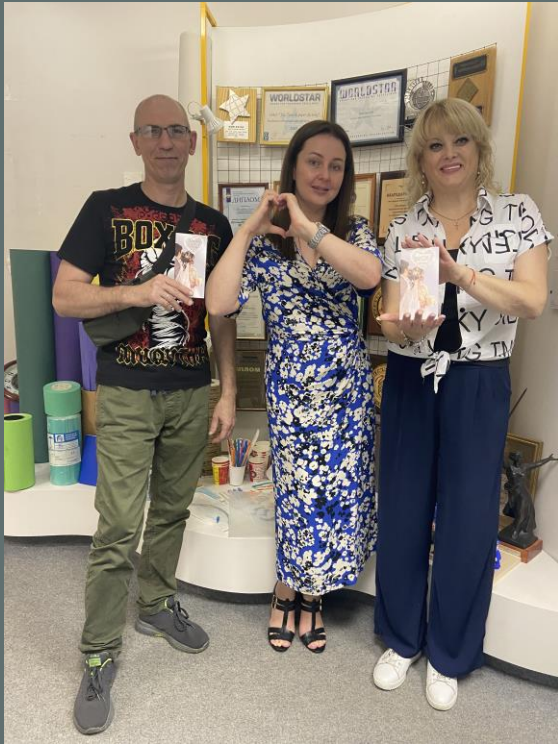
Поздравление с бракосочетанием