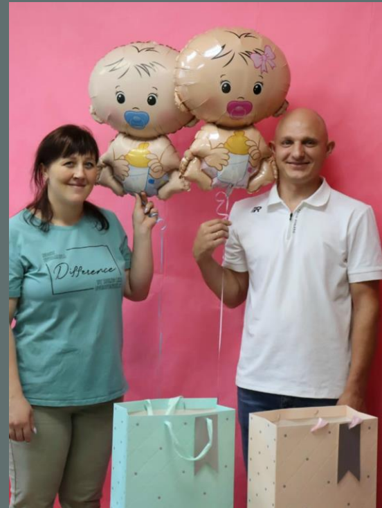
Поздравление с рождением ребенка