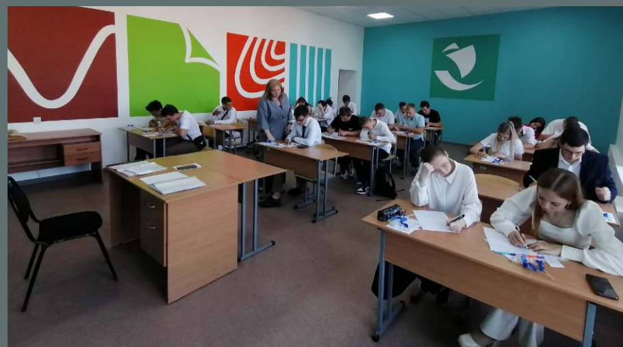
Открытие учебной специальности «Технология переработки древесины»