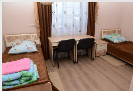
Комната для воспитанников интерната