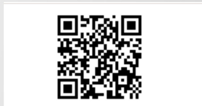
Сообщество «Феникс» в социальной сети «ВКонтакте»